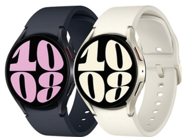
갤럭시 워치6 (2명)

* 경품 당첨에 따른 제세공과금 22%는 본인 부담입니다. * 상기 경품은 추첨순 사정에 따라 변경될 수 있습니다.