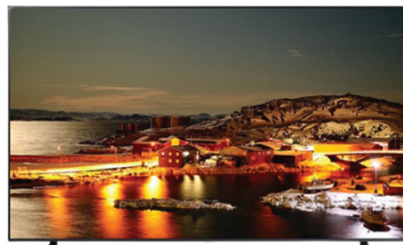
삼성 50인치 TV (1명)